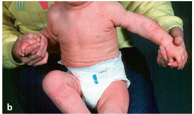
Abb. 4: Bei der Wahl der Therapie sollte die nummuläre Form (a) von der generalisierten Form (b) unterschieden werden.

Beim frühkindlichen atopischen Ekzem sollte die Anwendung des Prinzips «Fetten, Fetten, Fetten» allerdings in Abhängig-