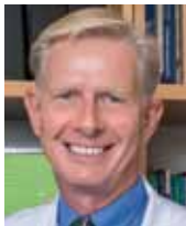
Pr Christophe Büla